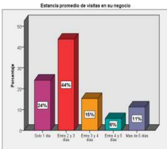
Figura 2 Estancia promedio de visitas en su negocio