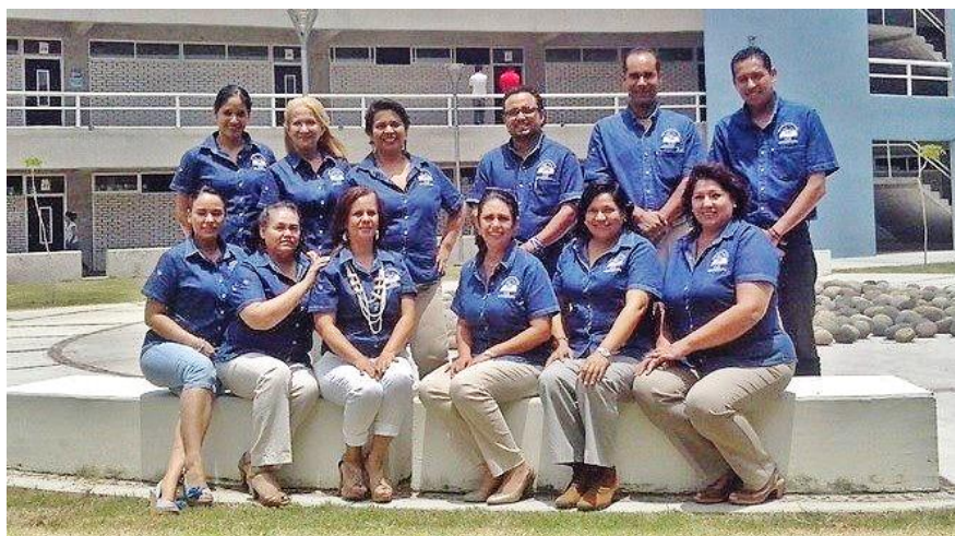
Fig. 1. La Academia de Gestión Educativa en Septiembre de 2014

Este documento, es la materialización del trabajo colegiado de los profesores integrantes de la Academia de Gestión Educativa de la Universidad Autónoma de Nayarit, a lo largo de más de cinco años de implementación de la opción de titulación por proyectos de gestión en el programa de Licenciatura en Ciencias de la Educación, así como en el transcurso de los módulos de la opción terminal en Gestión Educativa.