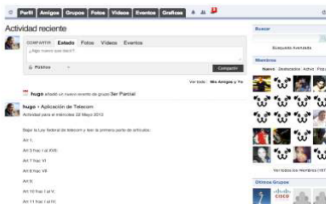
Figura 17.1 Inicio del VLE

Implementado el espacio de interacción se invitó a los alumnos a su utilización en los tres periodos cuatrimestrales del año 2012 y el primero del 2013, utilizándose como herramienta de soporte, la cual no influyera en las evaluaciones tradicionales de la UTSV.