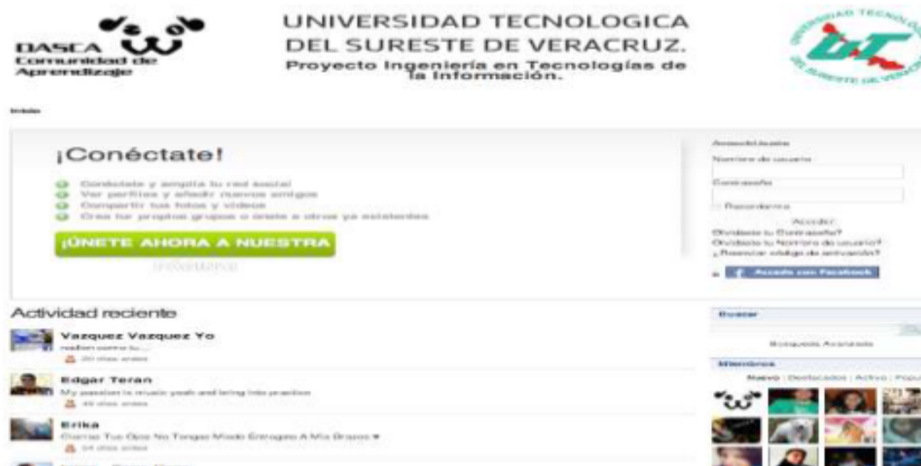
Figura 17 Portada de presentación del VLE

Para los casos de uso se desarrollo un VLE en la Universidad Tecnológica del Sureste de Veracruz (UTSV), validando su accesibilidad (Caldwell, B., Michael, C., Loretta, G. R., & Gregg, V. 2008), así mismo se valido su acceso a través de un dispositivo móvil (Rabin, J., & McCathieNevile, C. 2008) y de igual manera se respetaron las mejores practicas en su desarrollo (Ishida, R. 2007) con el fin de obtener la mejor usabilidad. En dicho VLE los alumnos acceden mediante un previo registro o accediendo con su cuenta de Facebook, después del acceso pueden dinamizar contenidos multimedia, pueden programar eventos en un calendario y ubicar la localidad con la herramienta Google Maps, compartir vídeos, imágenes y textos. Ver la figura 17.