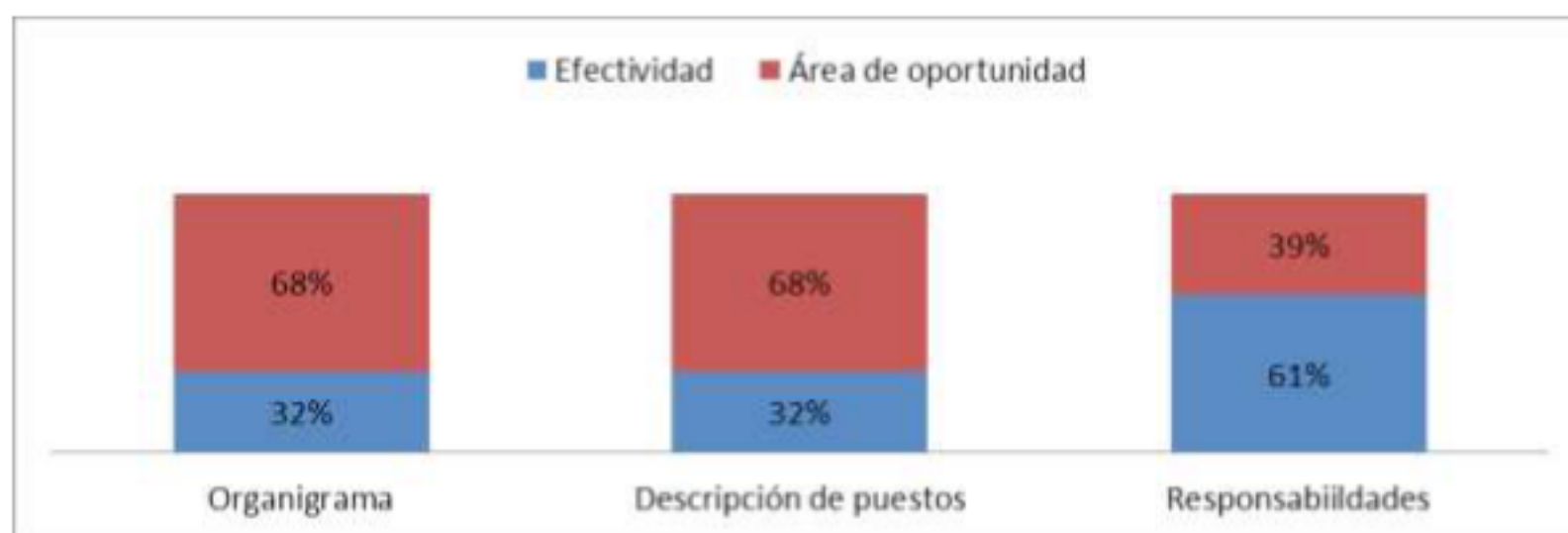
Gráfico 14 Eficiencia de la estructura organizacional

Este diagnóstico apunta a un cambio a través de cuestiones que pueden necesitar estudios posteriores. Es importante considerar cada uno de estos pasos, pues al orientar y capacitar a las empresas respecto a que es de vital importancia crear la filosofía de la organización, involucrando a la mayoría de los trabajadores, ya que de alguna manera va repercutir en su trabajo, en donde se espera un cambio positivo.