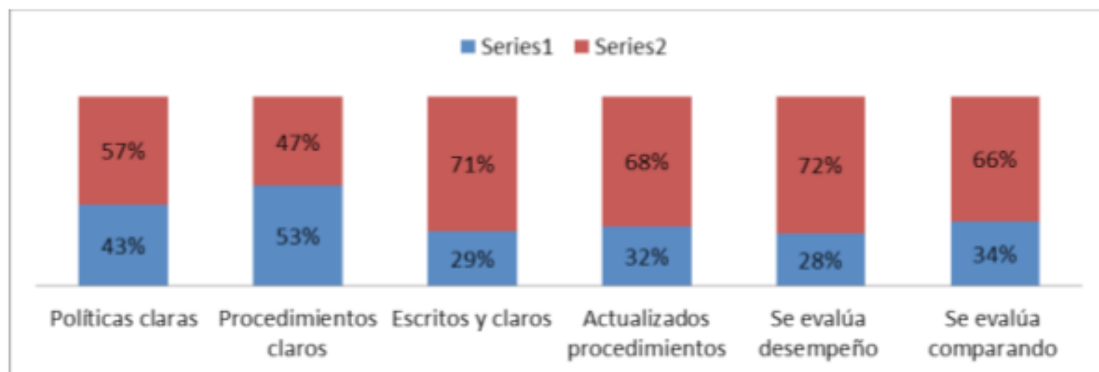
Gráfico 14.2 Eficiencia de políticas y procedimientos

En las mipymes de la región de Huejotzingo se obtuvo una calificación sobre las políticas y procedimientos con una eficiencia del 36%, siendo el resultado de promediar los datos obtenidos de los elementos que integran la categoría, políticas claras con una eficiencia del 43%, existencia de procedimientos claros 53%, la categoría de encontrarse escritos y claros con un 29%, la actualización de procedimientos con un 32%, con un porcentaje de 28% en la evaluación de desempeño del personal y no se evalúa comparando los resultados esperados en relación con los reales en un 34%. La calificación ideal de acuerdo a nuestra metodología sería del 100%. De forma visual los datos se encuentran en la gráfica 3.4.