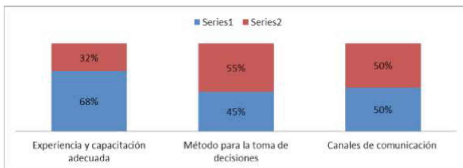
Tabla 14.4 Políticas y procedimientos