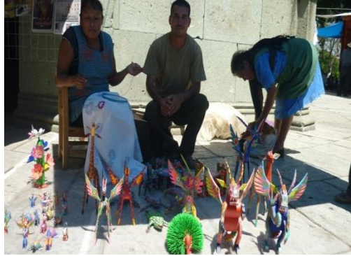
Figura 17.3 Mercancías con valor agregado