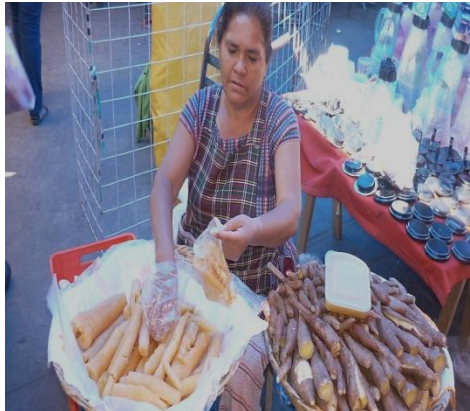
Figura 17 Productora de mercancías con valor agregado