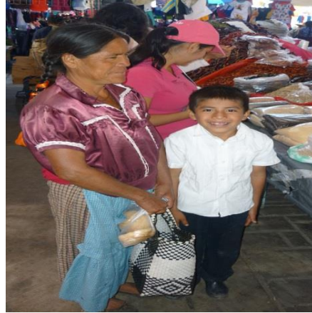
Figura 17.1 Compradores Regional/Local