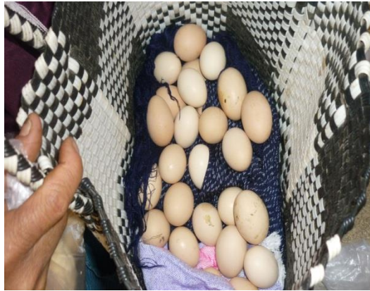
Figura 17.2 Mercancías sin valor