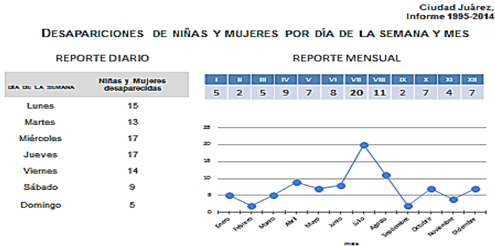
Gráfico 31.2 Desapariciones de niñas y mujeres por día de la semana y mes 33