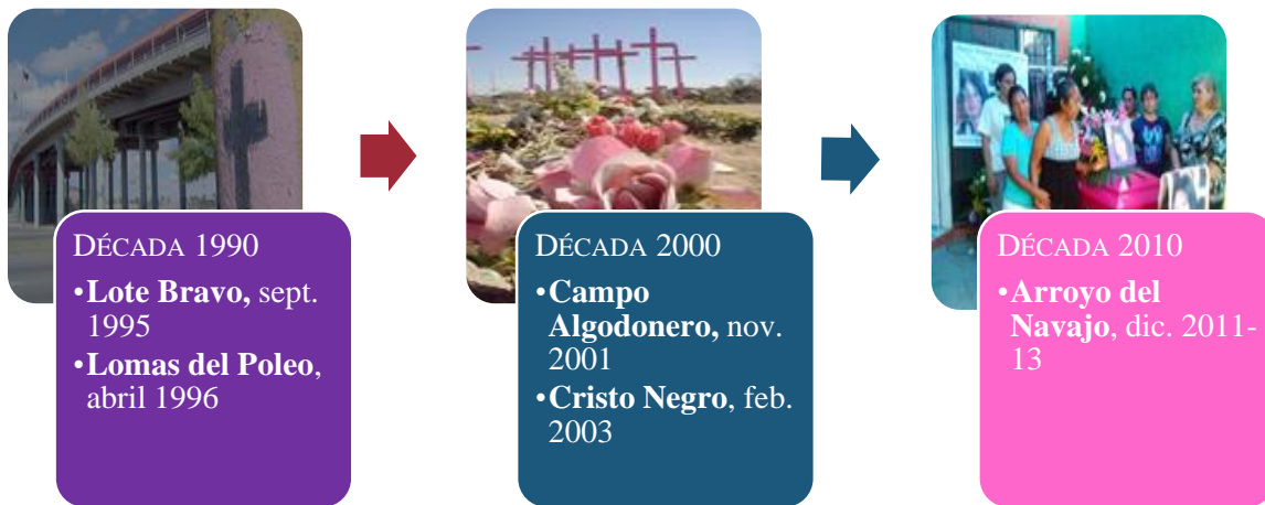
Figura 31 Línea de tiempo de la violencia feminicida en Juárez

Al mismo tiempo, ante trayectorias políticas de minorización para las mujeres, en especial jóvenes y empobrecidas, residentes de zonas precisas de la ciudad (Limas, 2004). La cadena de victimización iniciaba con la privación ilegal de la libertad de la víctima y su cautiverio para fines de tortura sexual o trata, a lo que sobrevino el asesinato como punto final de violencia, con la inhumación clandestina o el abandono de la(s) víctima(s) en algún solar o páramo de la región. Todo acontecía mientras sus familias víctimas les buscaban, sin apoyos oficiales adecuados. Esto ha sido para casos individuales o aislados como para casos de grupos de víctimas, desde 1995 hasta la actualidad. Es persistente una voluntad política de no esclarecimiento ante el “asesino corporativo” que comete estos crímenes de género. La línea de tiempo que sigue ilustra la secuencia de estos crímenes (Ver Figura 31).