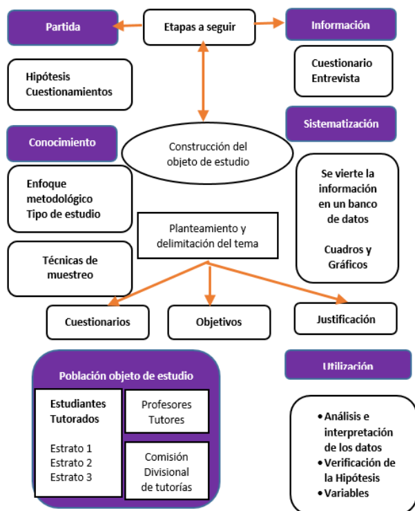
Figura 1 Construcción del objeto de estudio

El enfoque metodológico a seguir en esta investigación fue mixto (Cuantitativa-Cualitativa), dada la naturaleza del problema de estudio; a través de él se observaron tres sujetos distintos que comparten un mismo contexto institucional: el tutor, el tutorado y los responsables de la comisión de tutorías.