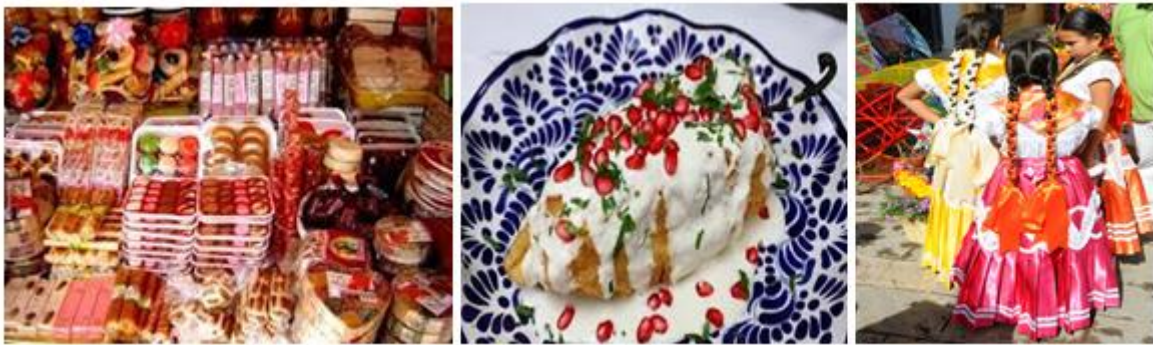
Figura 1 Productos gastronómicos y vestimenta tradicional en Puebla

“La participación de las mujeres como artesanas está presente en múltiples espacios campesinos e indígenas, y con frecuencia es mayor que la de los hombres, no obstante que este aporte no está reconocido en las estadísticas nacionales.” (Coral Rojas Serrano, 2017)