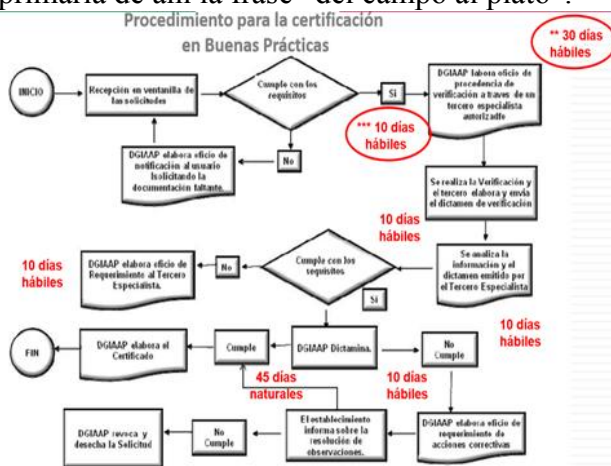
Figura 2 Procedimiento para certificación de Buenas Prácticas.

Las buenas practicas de Manufactura evitan la contaminación química física y microbiológica, concideran condiciones optimas de almacenamiento, temperatura, humedad, ventilación e iluminación, las instalaciones libres de humedad, olores humo, polvo gases, radiación y luz que afecte con superficie plana pavimentada, desagüe adecuado, agua potable, temperatura adecuada. Los pocedimientos innovadores tienen que ver con POES (procedimientos Operativos, Estandarizados de Saneamiento). De la higiene de los trabajadores también depende su salud, se cuida con lavado constante de manos y lavado diario de uniforme baño con desinfectantes especiales antes de ingresar a instalaciones y al salir de ellas. Materias primas inspeccionadas y almacenadas para evitar deterioro y contaminación. La innovación en procesos tiene que ver con la Trazabilidad y Rastreabilidad. La trazabilidad es el seguimiento de todo el proceso, la rastreabilidad se investiga desde el cliente, producto o servicio hasta su producción primaria de ahí la frase “del campo al plato”.